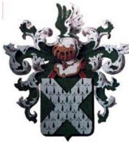
De Cupere/De Cuyper(e)