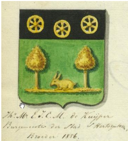
Aanvraag Eduard ij met..