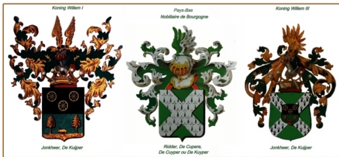
De Cupere tot De Kuijper een genealogie van Ridders & Jonkers